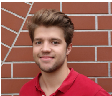
BRASSÓ BÁTOR SZTE-ÁOK